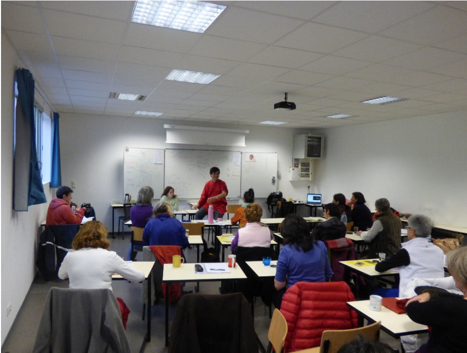
Cours théorique et pratique