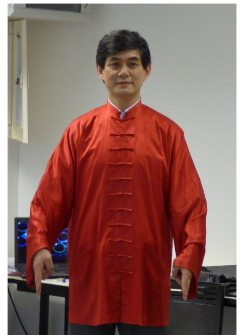
Technique de traitement : les doigts-épées